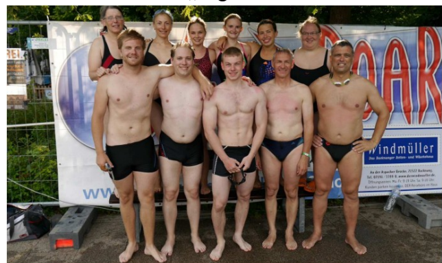
und unsere „Oldies“